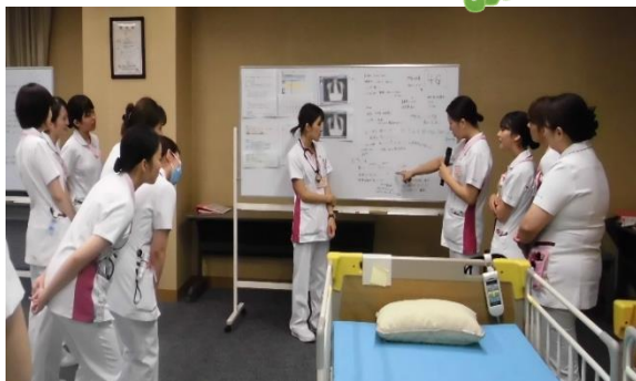
③フィジカルアセスメントを ケアにつなげる