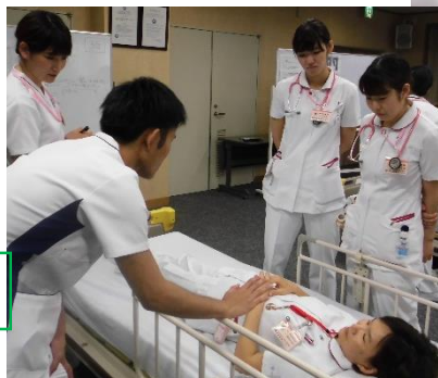
②フィジカルイグザミネーション に基づきアセスメント