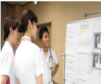
①カルテ情報からアセスメント